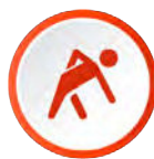
Prévention des TMS