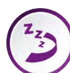
Sommeil & vigilance