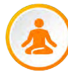
Bien-être au travail