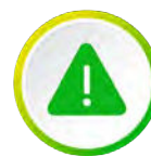
Prévention des conduites addictives