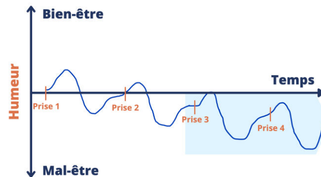
Fig. 1 État affectif négatif